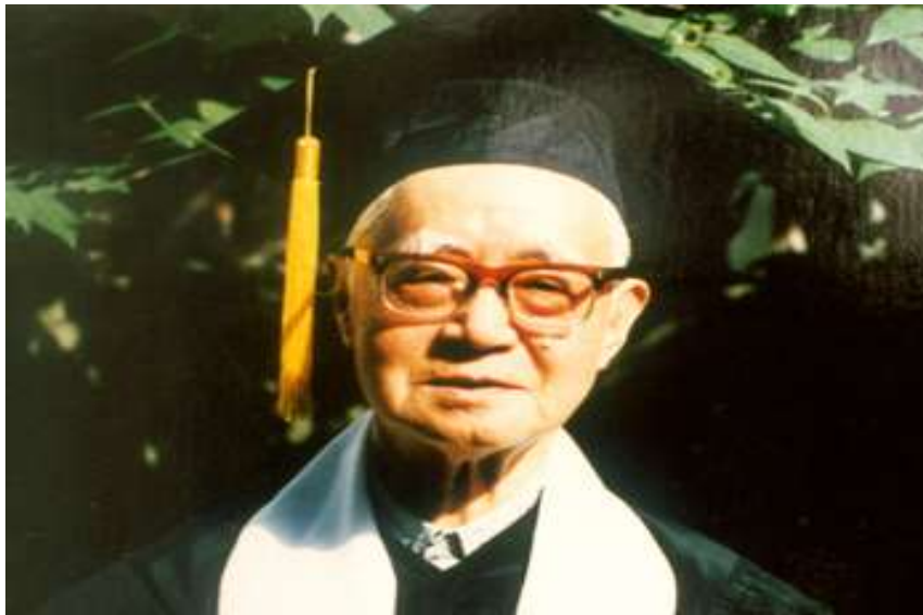
何兹全： 著名历史学家。主要研究汉唐经济史、兵制史、寺院经济和魏晋南北朝史几个方面。是国内最早倡导魏晋封建说的学者之一。