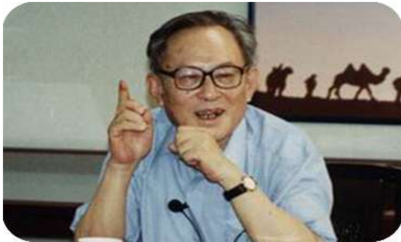
冯尔康： 曾兼任中国社会史学会会长、中国谱牒学会副会长。现兼任南开大学社会史研究中心学术委员会主任、安徽大学徽学研究中心学术委员、中国人民大学清史研究中心学术委员、国家清史编纂委员会委员。