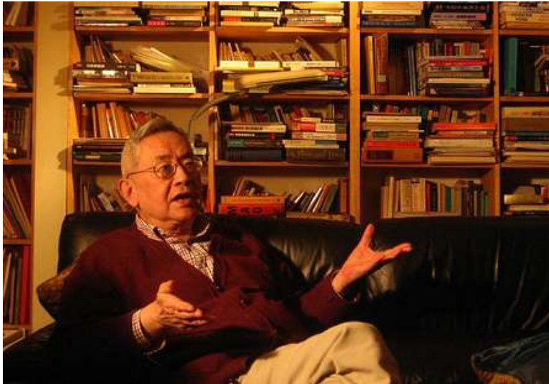
邓起东： 中国科学院院士。曾任中国地震局地质研究所副所长和学位评定委员会主任、名誉主任。现任研究员、博士生导师、中国地质学会和中国地震学会理事、中国地震学会地震地质专业委员会主任。