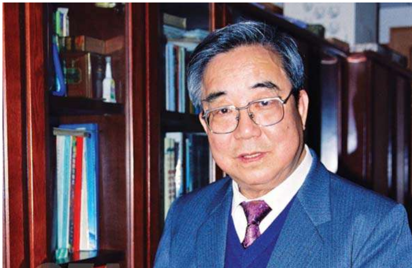
沈祖炎： 中国工程院院士。同济大学教授、博士生导师。曾任同济大学副校长、研究生院院长、上海防灾救灾研究所所长、国家土木工程防灾重点实验室主任、全国高校土木工程专业指导委员会主任及评估委员会主任、美国结构稳定研究委员会委员、国际桥梁与结构协会钢木结构委员会委员。