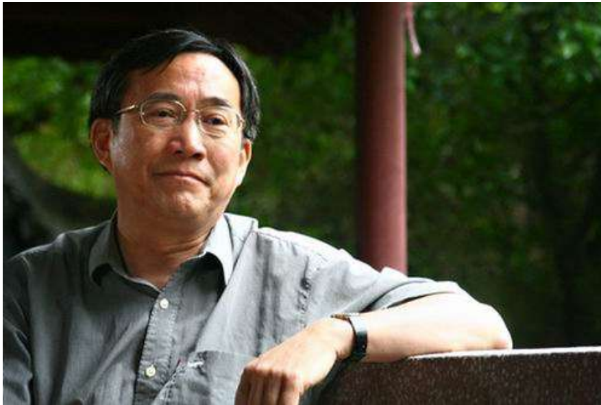
顾易生： 复旦大学中国语言文学研究所教授、博士生导师兼古籍研究所及国际文化交流学院学术委员、教授。