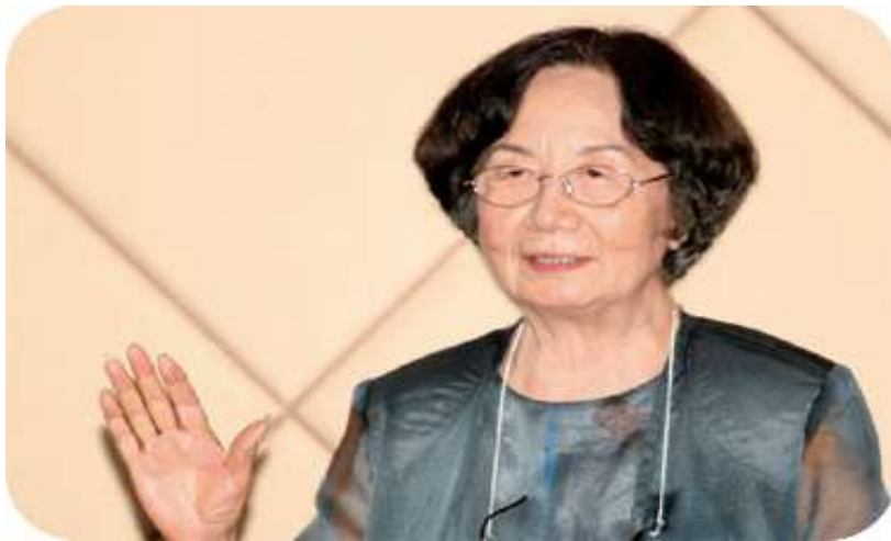
金开诚： 中国古代文化和古代文学大师，北京大学教授、博导。全国政协第七、八、九、十届常委，九三学社第九、十、十一届中央委员会副主席，中央文史研究馆馆员，中央社会主义学院、中华文化学院院长。