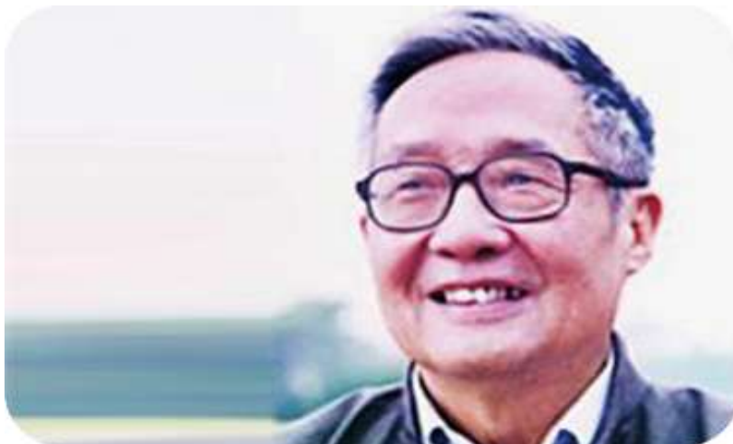
霍松林： 陕西师范大学文学院名誉院长、教授、博导。古代文学及文学理论权威学者，著名文艺理论家、中国古典文学专家、诗人、书法家，现任中华诗词学会名誉会长、陕西诗词学会会长。