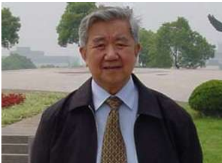
钱七虎： 中国工程院院士。全国著名的防护工程专家。历任南京中国人民解放军工程兵工程学院教授、院长等职。并任国务院学位委员会学科评议组成员、中国岩土力学与土木工程学会常务理事。